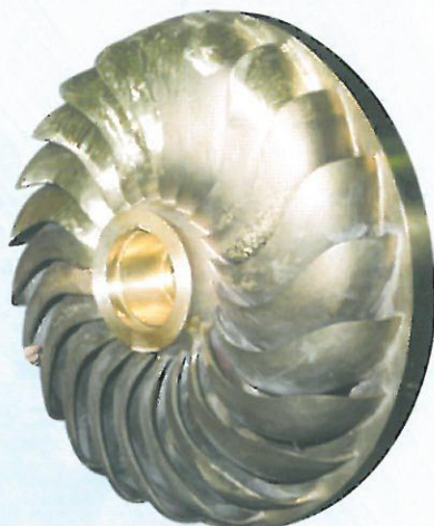
PELTON-RAD ODER ÄHNLICH