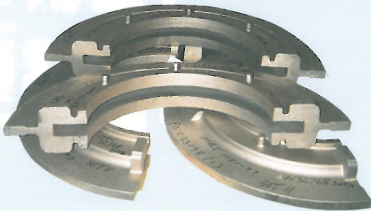
DICHTUNGEN FÜR WELLENANLAGE