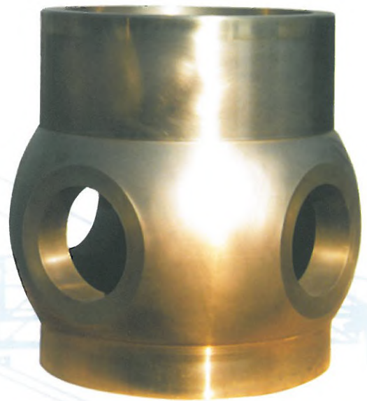
NABE BIS 2000 KG