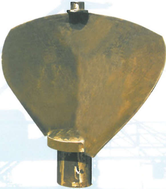
PROPELLERBLATT BIS 1500 KG