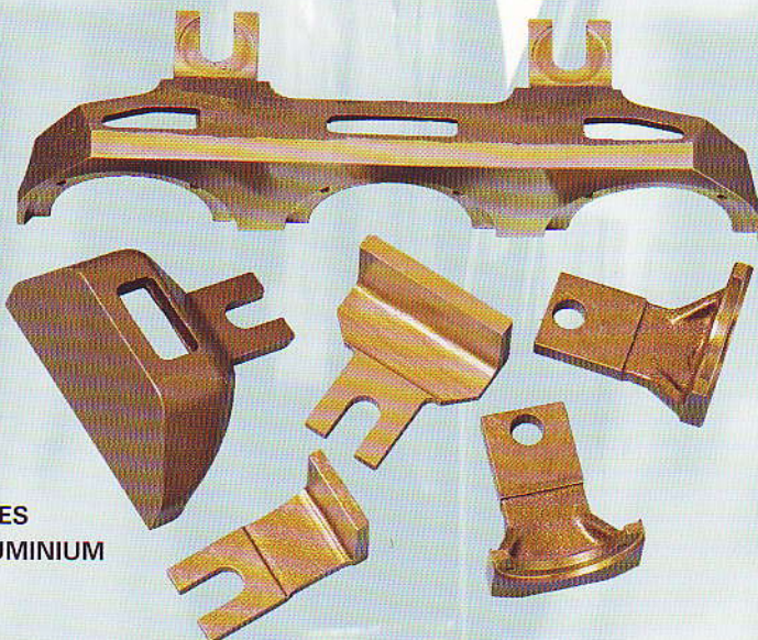
PINCETTES EN CUPRO ALUMINIUM