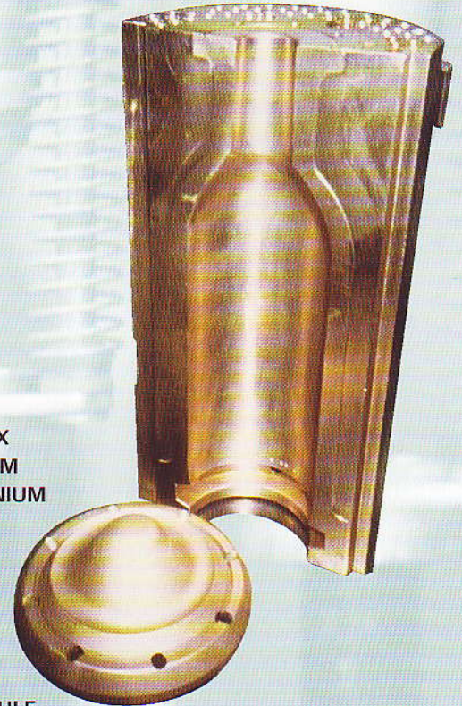
FOND DE MOULE